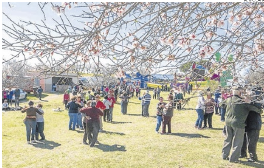
► La floración de los almendros es toda una fiesta en la localidad.