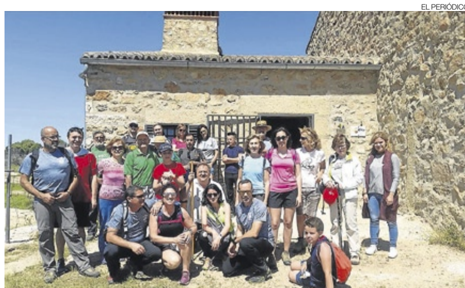
►► El grupo de senderistas tras la visita y degustación en el centro de interpretación.