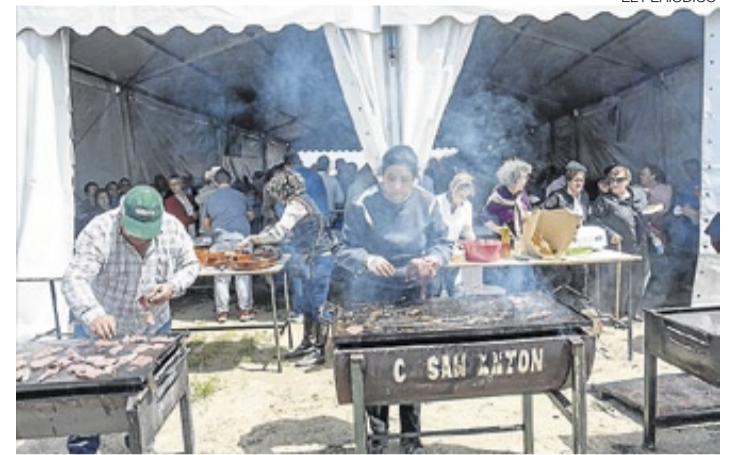
▶ Momento del reparto de la carne de ternera.