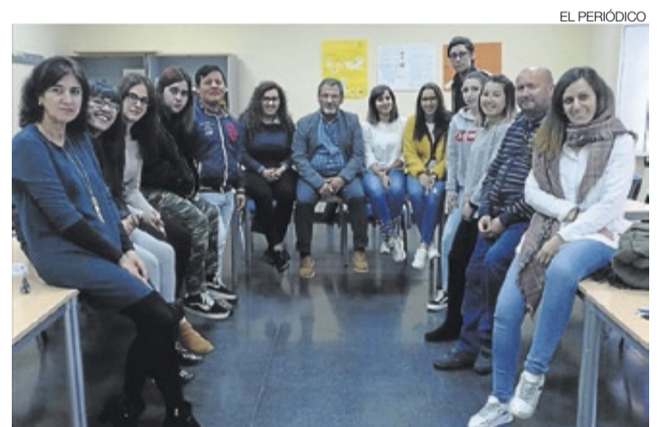
▶ El alumnado con el alcalde al inicio de la acción formativa.

con una camiseta. Hubo participantes de todas las edades, porque -además de la ruta- se instalaron castillos hinchables en el pabellón para el disfrute de los más pequeños. La ruta partió desde la localidad hacia la ermita situada a cinco kilómetros del pueblo, donde había puestos con aperitivos para reponer fuerzas y retomar la vuelta a la localidad. El ayuntamiento de Aliseda quiere agradecer la colaboración y la participación en esta buena causa. ≡