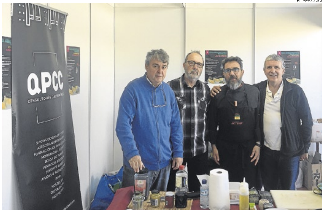
► El alcalde y concejales en uno de los momentos de las catas de la Feria Agroalimentaria de Navas del Madroño.