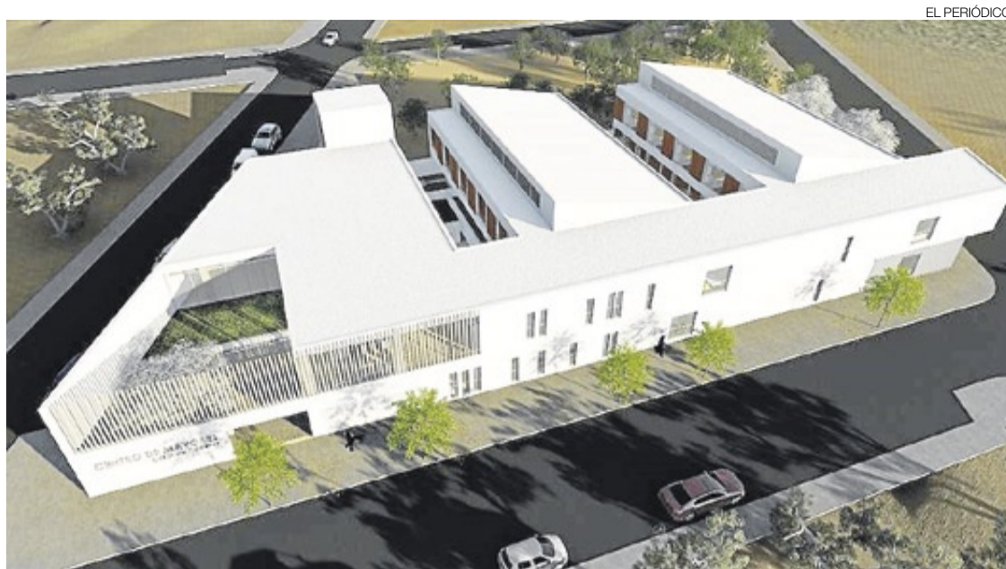
►► Simulación constructiva de la nueva residencia de mayores.