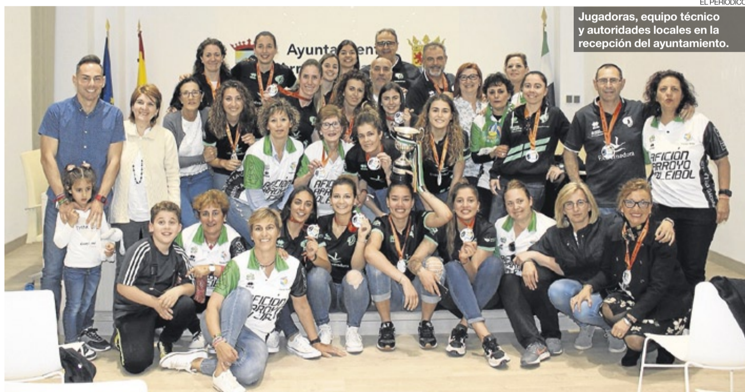
Jugadoras, equipo técnico y autoridades locales en la recepción del ayuntamiento.