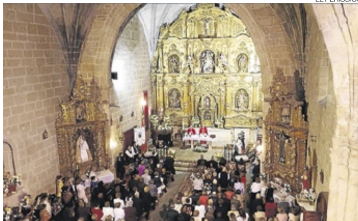
► Celebración de la Misa Mayor de San Isidro.

El programa religioso con la traída de la imagen de San Isidro mediante procesión realizada por los hermanos de carga del Santo, y la entrega del bastón de mando por el alcalde al patrono. El sábado 18 fue la misa y ofren-