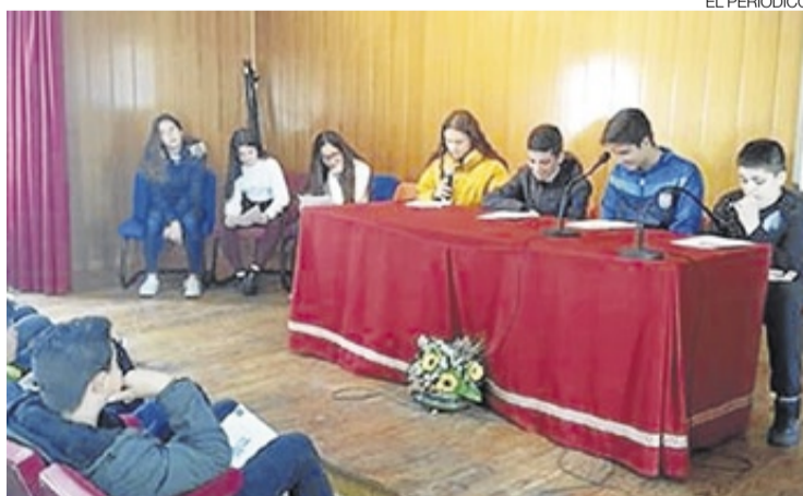
► Un grupo de escolares en el momento de las lecturas.

El día 23 de abril se celebró, como viene siendo habitual, el Día del Libro en el salón de actos de la casa de cultura de Garrovillas. Se contó con la participación del club de mayores, los alumnos del instituto de Garrovillas y resto de participantes con lecturas libres en distintos idiomas. Las lecturas, organizadas por la biblioteca, fueron un repaso a nuestro rico folclore de leyendas, romances y cuentos garrovillanos como 'La ventana del diablo' que se encuentra en San Pedro, el Castillo de Alconétar, el Romance del rey Moro y 'Cuentuh garrovillanuh'. El alumnado de 2º y 4º de educación secundaria participaron con las