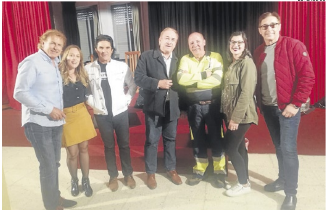
► Los miembros del grupo rociero Ecos del Rocío antes de su actuación.

El lunes 15, día festivo local, continuaron los actos festivos con los partidos de fútbol disputados entre varias categorías. Du-