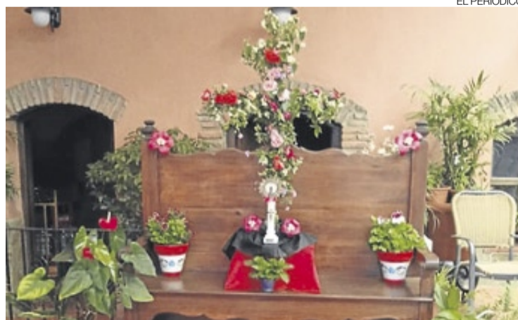
► Una de las Cruces de Mayo elaborada en la localidad.

Además, como cada 3 de mayo, Navas del Madroño, evoca la tradicional fiesta de las cruces de mayo y muchos vecinos instalan sus altares decorados con cruces y flores para que el público pueda visitarlas. Una comitiva visitó las