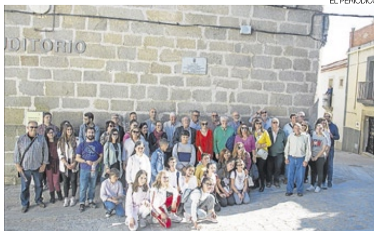
▶ El grupo tras la colocación de la placa conmemorativa.

El intenso calendario cultural de Brozas culminó el 27 de abril con la celebración de un acto para reivindicar la importancia de la familia Nebrija en la historia de Brozas durante el siglo XVI. El acto, dentro del proyecto 'Los caminos de Nebrija' y del trabajo que la Fundación Lebrija lleva a cabo para conmemorar el V Centenario del fallecimiento de Antonio de Nebrija en 2022, se inició con la recepción municipal de la delegación procedente de Lebrija y continuó en la fachada del Auditorio de Las Comendadoras donde se descubrió una placa conmemorativa de la estancia del famoso gramático en Brozas.