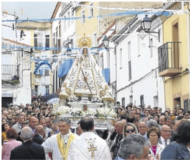
▶ La Virgen del Campo por las calles de Aliseda a hombros de sus fieles.