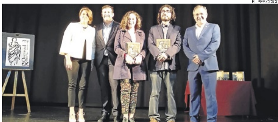
▶▶ Autoridades y premiados en la gala de entrega de premios.