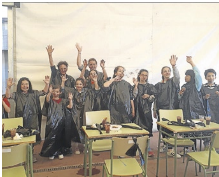
► Los pequeños disfrutaron con el chocolate a ciegas.

rante la mañana del lunes, también se llevó a cabo una yincana cultural por las calles del casco antiguo alcantarino.