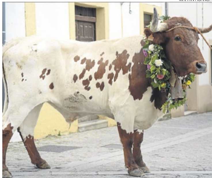
▶ El Toro de San Marcos engalanado para la ocasión.

A las 12.00 horas de la mañana, en la plaza Príncipe de Astu-