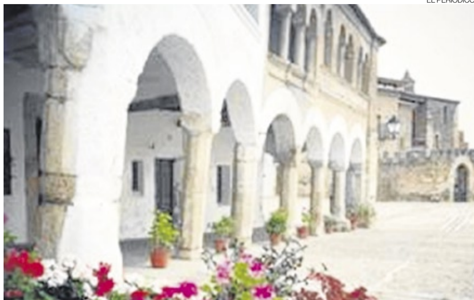
► La plaza porticada de Garrovillas es el eje central de la población.