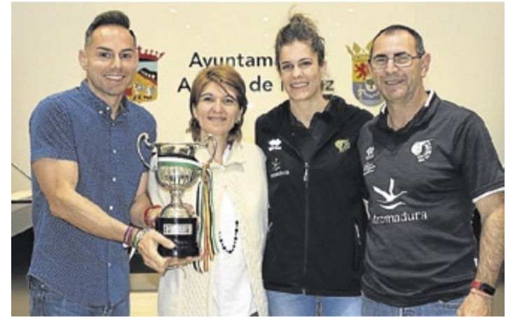
▶ La alcaldesa, el teniente alcalde y la capitana del equipo.

Es, sin lugar a dudas, una verdadera apuesta del Ayuntamiento de Arroyo de la Luz, una apuesta para poner en valor los productos de la localidad a través de distintos eventos y para ello convoca la XIV Fiesta Gastronómica en donde se promocionarán productos como la morcilla fresca y el vino casero, unos buenos ejemplos de los exquisitos productos que podemos encontrar en Arroyo. ≡