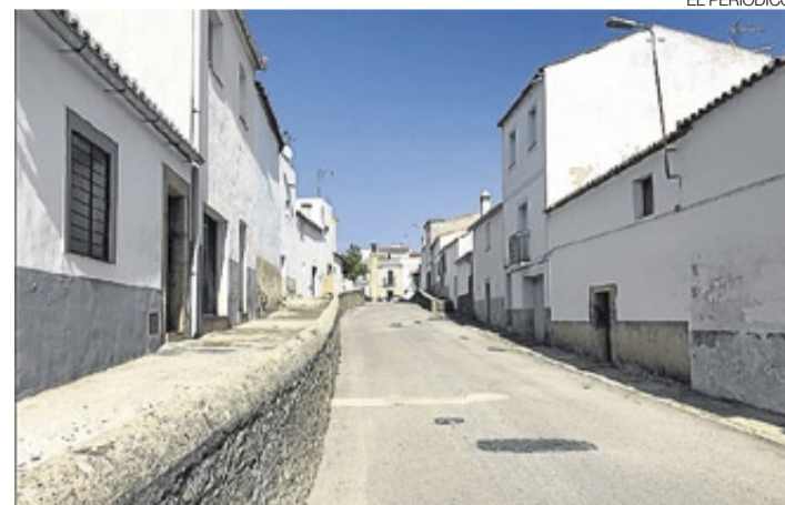
►► La popular calle Agapita será objeto de reformas.

A estas actividades se suman la mesa que fue instalada en el vestíbulo de la casa de cultura, con el lema 'Adopta un libro' en la que los usuarios y usuarias podían adquirir de forma gratuita libros y revistas. Y el book-crossing o libro viajero, una actividad que tiene su origen en EEUU y que pretende crear una red de lectura e intercambio de libros a nivel mundial, iniciativa a la que nos sumamos, por ello aún podéis encontrar libros en cualquier rincón. ≡