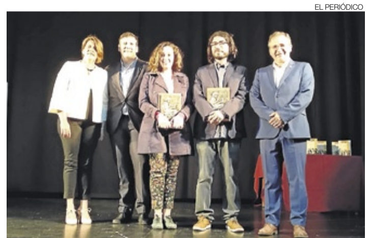
►► Autoridades y premiados tras la entrega.

zó a partir del proyecto básico. Posteriormente se sacará a concurso la adjudicación de la empresa constructora que materializará este proyecto y que no tendría que dilatarse más de dos meses. Se trata de un proyecto para el cual se han destinado muchos esfuerzos. ≡