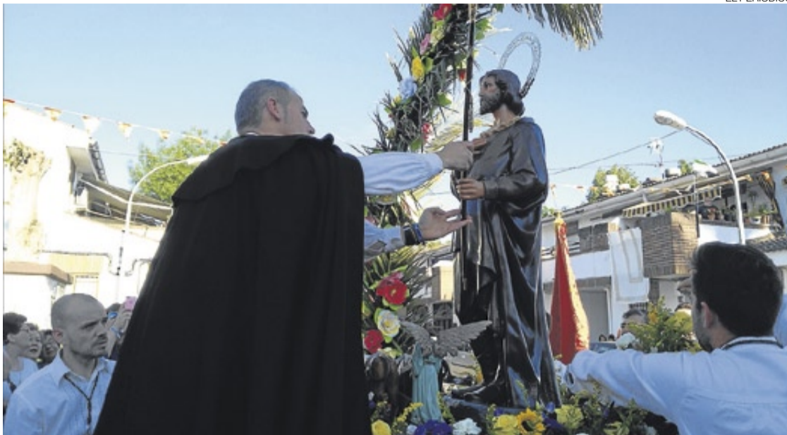
► El alcalde entrega el bastón de mando al patrón, san Isidro.