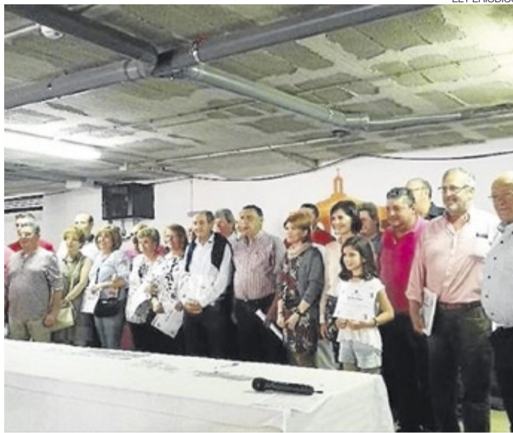
▶ Entrega de premios a los vinos en la Fiesta Gastronómica de la Morcilla.

El jurado encargado de puntuar las distintas botellas estuvo compuesto por 5 personas que, además de tener vinculación con la localidad, son conocedores de los vinos que se elaboran en el municipio. Desde la organización agradecieron su desinteresada colaboración, además manifestaban que «realizan una concienzuda labor que desarrollan para llevar a cabo la puntuación