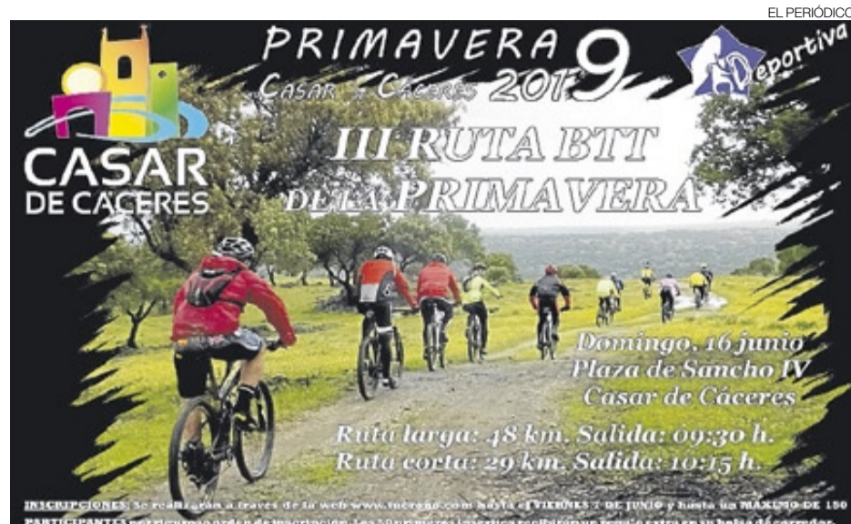
►► Cartel de la tercera edición de la ruta BTT de primavera.