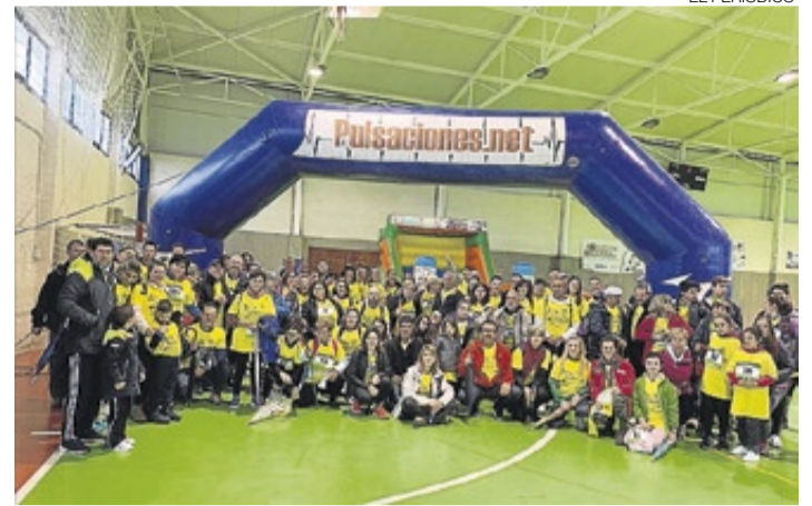
▶ El nutrido grupo de participantes en la línea de salida.

Después de todos los festejos, los aliseños gozaron de la patrona en la localidad durante 15 días, hasta el domingo, 5 de mayo, que se celebró una misa y la posterior despedida en la parroquia, para acompañarla a hombros hasta su ermita y celebrar la romería en el paraje de la finca El Hito. ≡