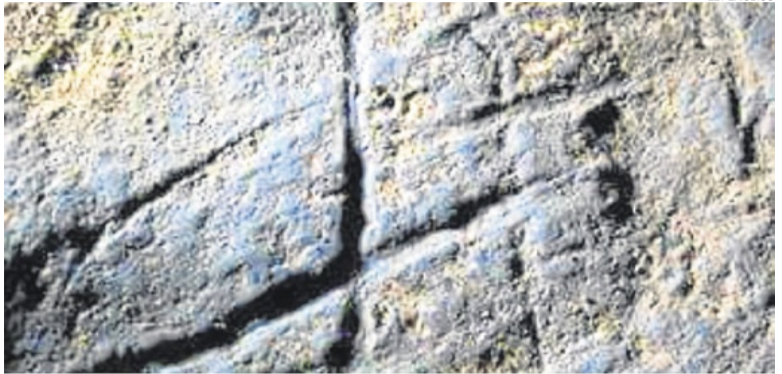
►► Grabados ► Uno de los grupos de grabados rupestres de carácter lineal.

Respecto a los grabados a base de cazoletas y canales, se cree que sus comienzos son a partir del neolítico (no se descarta que también se hicieran en el paleolítico) y que se fueron haciendo más comunes en la edad del bronce y el hierro. Este tipo de grabado está más extendido por el término municipal e incluso en las mismas calles del pueblo, formando una gran cantidad de conjuntos, probablemente más