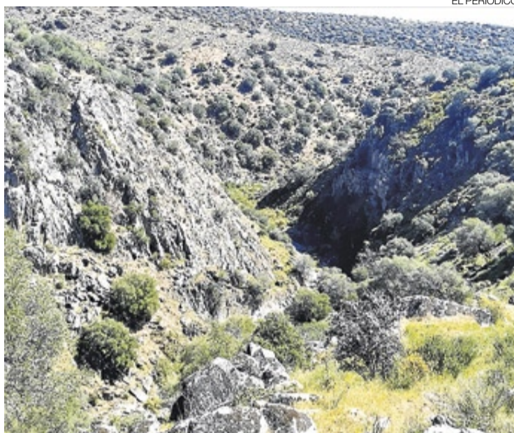
▶▶ Paraje de El Cabril, en la zona ribereña de Monroy.

En el recorrido de las mismas podemos atravesar la dehesa boyal de la localidad y realizar la ruta de la Villa Romana donde pue-