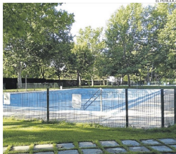
►► Los servicios de la piscina generan nuevos empleos.

to el proceso de contratación de otros 6 trabajadores a través del Decreto de Empleo Social, por el que se contratará a dos operarios de limpieza, dos peones de jardinería, un oficial de la construcción y un peón de la construcción. A estos se añadirán un oficial de la construcción y otro peón con fondos propios para la realización de varias obras municipales. Por último, cabe destacar que también está en proceso la contratación de un trabajador por la subvención 'Diputación Integrada' destinada a la contratación de personas con discapacidad. ≡