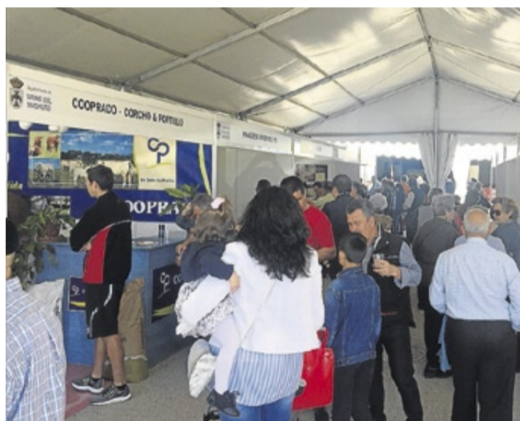
► Numeroso público visitó las instalaciones de la feria.