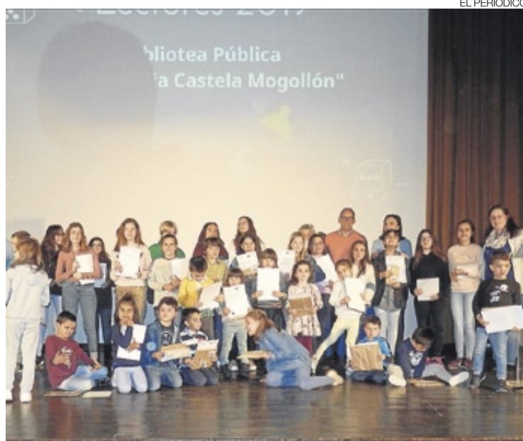
►► Acto de entrega de premios de la Semana del Libro.

El 23 de abril, Día del Libro, se celebró el Acto Conmemorativo en el que leyó el Manifiesto del Día del Libro y se entregaron los premios a los buenos lectores del Colegio Los Arcos, el Instituto Los Barruecos y la Biblioteca Pública