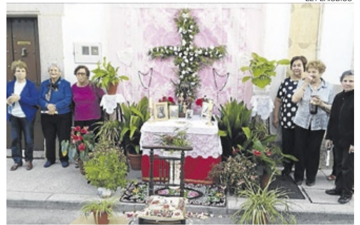
► La cruz ganadora en la calle Nueva.