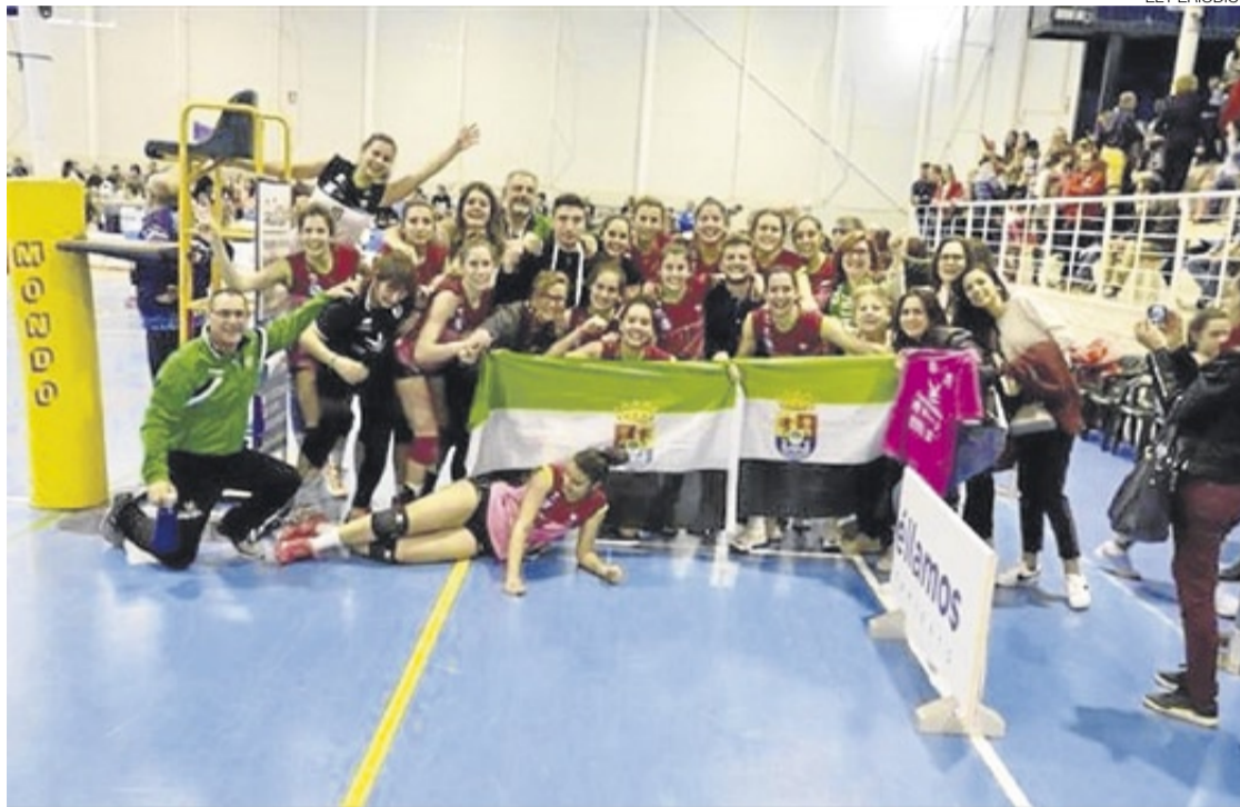
► Las jugadoras junto al equipo técnico tras la finalización del partido.

El conjunto murciano partía como favorito, a decir del personal técnico desplazado a la localidad manchega de Socuéllamos y de los comentaristas del encuentro, pero el cuadro cacereño, cuando salta a la pista, se olvida de predicciones y previsiones, y solo sabe seguir adelante como un solo corazón, el de una localidad, el de una provincia, el de una región.