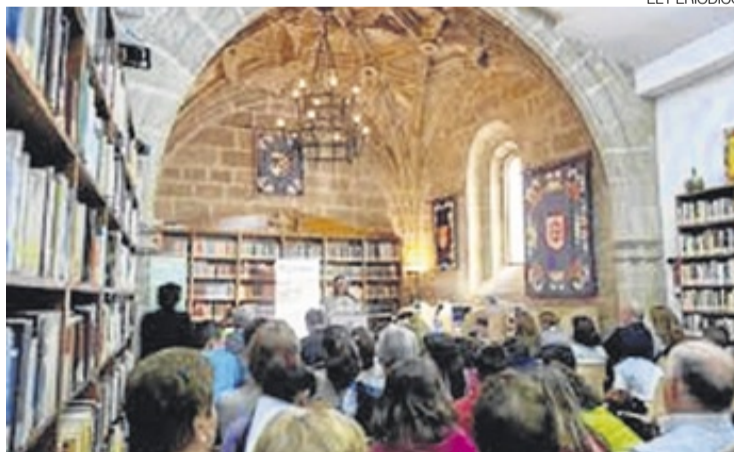
► Sala de lectura de la biblioteca de Alcántara.

La Semana del Libro dio comienzo con las actividades destinadas para el alumnado y profesorado del Colegio Miguel Primo de Rivera, y el protagonista de todas las actividades fue Antonio de Nebrija, el más importante estudioso de la lengua de su época, y cuya obra más destacada y famosa es La Gramática Castellana . Las actividades se llevaron a cabo en la biblioteca municipal donde al término de las mismas, Juani, la bibliotecaria, procedió a premiar a los mejores lectores del presente curso. El viernes 26, se pudo disfrutar de un impresionante concierto con el Saxtrem Saxophone Quartet. Y como colofón a la se-