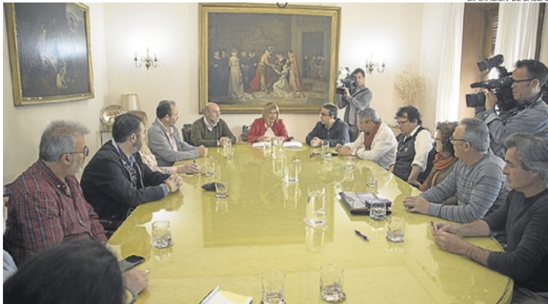
► Momento de la reunión entre miembros de la diputación y los representantes de sindicatos.

lo que sus pueblos necesitan», afirmó. En estas dos reuniones se firmaron también con 34 ayuntamientos convenios para avanzar y finalizar obras en centros y residencias de mayores. Unos convenios que están enmarcados en el acuerdo que mantiene la Junta de Extremadura, a través del Sepad y las dos diputaciones provinciales. La presidenta aprovechó estos encuentros con los representantes municipales para, en este final de la legislatura, agradecer a los alcaldes y alcaldesas su trabajo y esfuerzo por hacer llegar a la diputación las necesidades y demandas de sus municipios. ≡