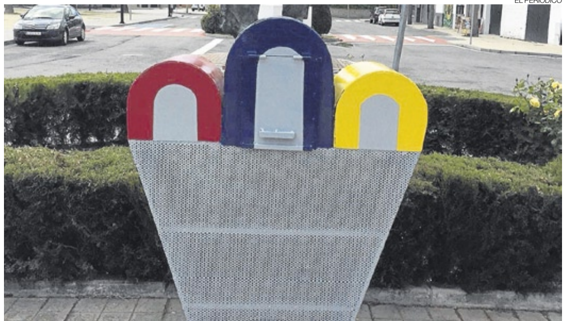
► El contenedor personalizado con Los Arcos ya está instalado en la plaza de la Nora.

te para establecer puntos de recogida de estos productos siempre para fines benéficos, el Ayuntamiento de Malpartida de Cáceres planteó la elaboración de un sistema para la recogida y ha construido unos contenedores que ha personalizado con el emblema de Los Arcos gracias a los trabajadores municipales ya son una realidad. El contenedor personalizado está perfectamente integrado en el mobiliario urbano y resulta muy práctico. La población malpartideña ha acogido muy bien la idea y ya se han vaciado varias veces. ≡